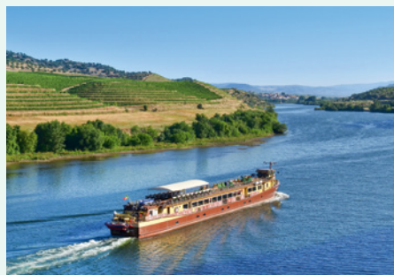
Sie fahren mit der Spirit of Chartwell.

„Mit der komfortablen Spirit of Chartwell entdecken Sie in sehr privater Atmosphäre das Douro-Tal.“